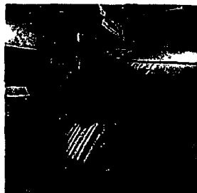
Протечка через крышку гентри в верхней части