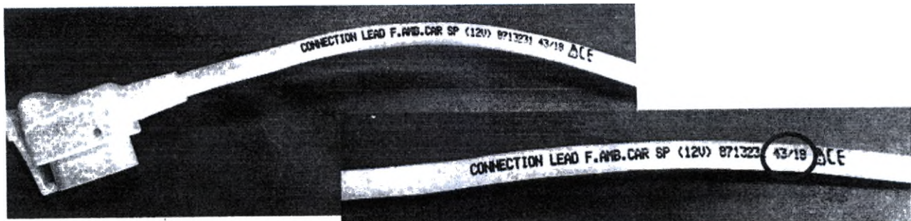
Рис. 2 Размещение даты производства

Изделия, которые могут иметь описанную выше неисправность, изготовлены в период с октября 2017 года по сентябрь 2018 года. Дата производства указана на изделии в виде номера недели и года выпуска (НН/ГГ) и находится возле коннектора для подключения к насосу (см. рис. 2 внизу).