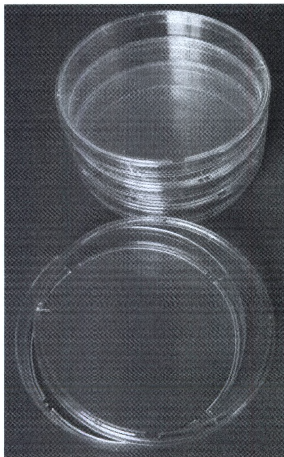
Фотографическое изображение 3. Внешний вид чашек Петри